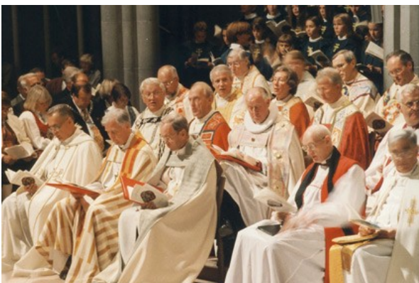
Fra underskrivelsen af Porvoo i Nidaros Domkirke i 1996.

Det nye i drøftelserne mellem de lutherske og anglikanske kirker i Nordeuropa var imidlertid, at den "apostolske succession" af alle parterne blev forstået i en meget bredere betydning nemlig som en kontinuitet i hele kirkens liv og virke. Det betød, at de anglikanske kirker for første gang kunne anerkende ordinationer foretaget i kirker uden en ubrudt bisperække (som fx Den danske Folkekirke). Den historiske bisperække ses ikke længere som en forudsætning for at være sand kirke, men bispevielsen er derimod et synligt tegn på kirkens enhed.