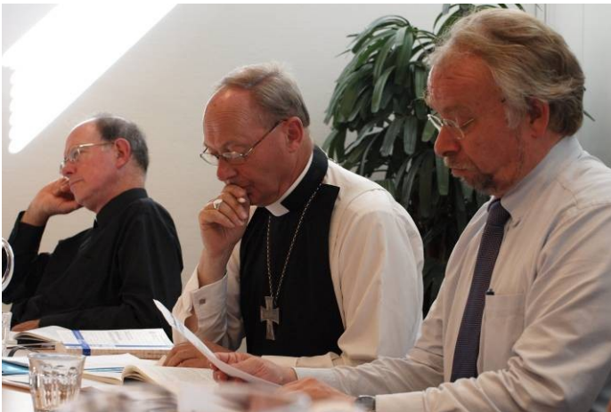
Fra forhandlinger mellem folkekirken og anglikanere om Porvoo, Kastrup, 2009.

Meget har imidlertid ændret sig siden 1995: De anglikanske kirker anerkender fx i dag ordinationer foretaget af kvindelige biskopper eller en domprovst som biskoppens stedfortræder. Disse forhold betød, at Folkekirken mellemkirkelige Råd 2009 besluttede at tiltræde Porvoo Erklæringen, efter at biskopperne forinden var blevet hørt om det teologiske indhold heri.